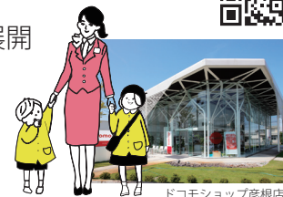
ドコモショップ彦根店